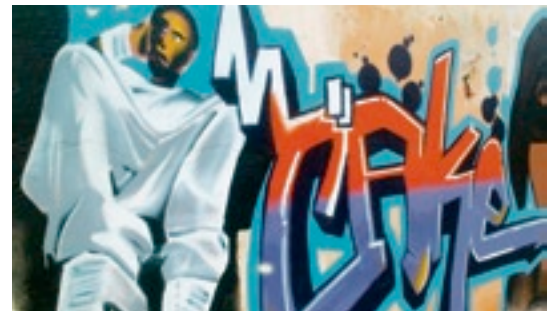
«Cake» – Strassenkunst aus Wangen an der Aare. Yves