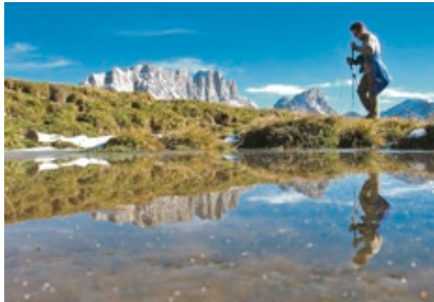
Das Wandern ist des Eidgenossen Lust. Keystone

Herausgeberin: 20 Minuten AG Verleger: Pietro Supino Geschäftsführer: Marcel Kohler Chefredaktor Print: Marco Boselli Chefredaktor Online: Hansi Voigt Nachrichtenagenturen: Associated Press Reuters Schweizerische Depeschentagentur Sportinformation Adresse: Werdstrasse 21 8004 Zürich Telefon Redaktion: 044 248 68 20 Telefon Verlag: 044 248 66 20 Fax Redaktion: 044 248 68 21 Fax Verlag: 044 248 66 21 E-Mail Redaktion: redaktion@20minuten.ch Inserate: verlag@20minuten.ch Vertrieb: 20min.verlagslogistik@tamedia.ch Telefon: 044 248 62 52 Druck: Tamedia AG Druckzentrum 8021 Zürich Ombudsman der Tamedia AG: Arthur Liener, Postfach, 3000 Bern 13