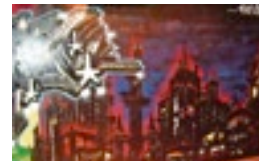
Düstere Aussichten. Shep*Art