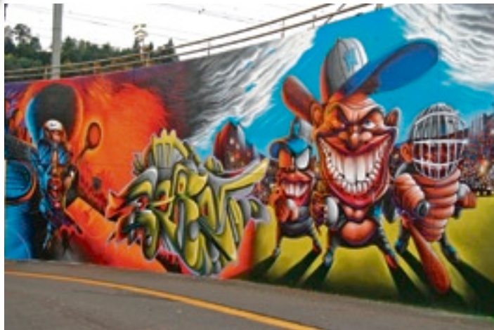
Die Werke des Graffiti-Künstlers Ezra sind im In- und Ausland bekannt. Ezra

Ende Juli findet in der Roten Fabrik in Zürich das Meeting of Styles statt, bei dem Graffiti-Profis aus aller Welt ihr Können zeigen. Einen Vorgeschmack darauf bieten die zahlreichen Einsendungen der 20-Minuten-Online-User, die ebenfalls zur Spraydose gegriffen haben und ihrer Kreativität freien Lauf liessen. Weitere Beispiele von Graffiti-Kunst auf höchstem Niveau finden Sie unter www.graffiti.20min.ch