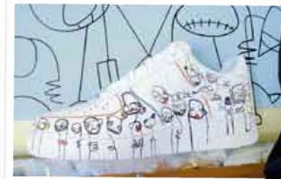
Move It Céline Quadri - alias C-Line - braucht keine Leinwand. Ihre Kunst führt sie auf Turnschuhen spazieren.