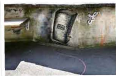
No Limit Das Kabel der Music-Box rankt sich über die Mauer und die Strasse. Urban Art beim Drahtschmidli in Zürich.