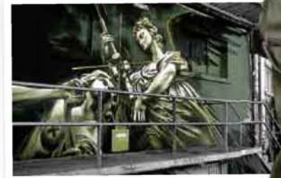
Mystery Eine Rampe in Biel wird zur Kunst - und zur Reflektion von Gut und Böse. Von Wes21, alias Remo Lienhard.